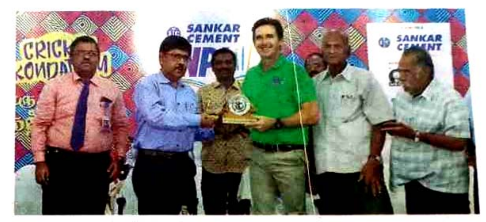
விழாவில் ஆஸ்திரேலிய கிரிக்கெட் வீரருக்கு நினைவு பரிசு வழங்கப்பட்டது. அருகில் கல்லூரி நிர்வாகிகள் உள்ளனர்.

தென்தமிழகத்தில் கல்லூரி நிறுவ னர் நினைவு கி ரிக்கெட் போட் மகள் ஆண்டுகோ றும் மாணவர்கள்,